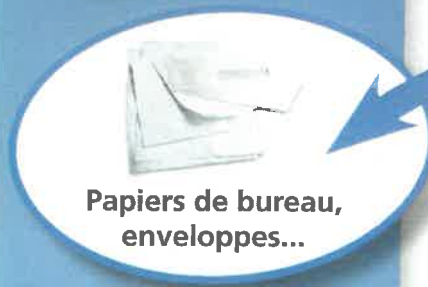
Papiers de bureau, enveloppes...

1. Au 1 er Janvier 2018 Extension des consignes de tri papier Tous les papiers devront être jetés dans le bac bleu.