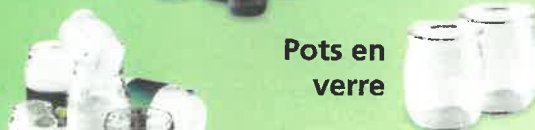
Pots en verre