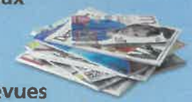
Revue et magazines

2. Entre Avril et Mai 2018 Dans tous les foyers, distribution de nouveaux bacs jaune, vert et OM Les anciens bacs seront remplacés