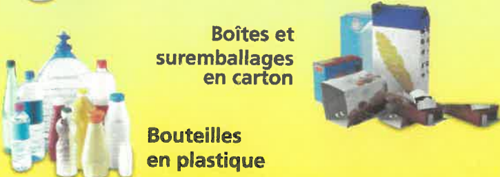
Boîtes et suremballages en carton